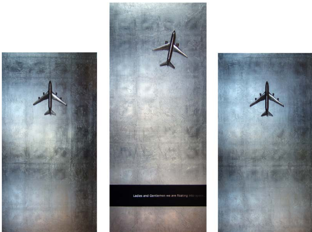
«Ladies and Gentlemen...» τρίπτυχο, 2006, φύλλα αλουμινίου, ακρυλικό, μεταλλική βαφή, παιδικό παιχνίδι, 170 X 210 cm