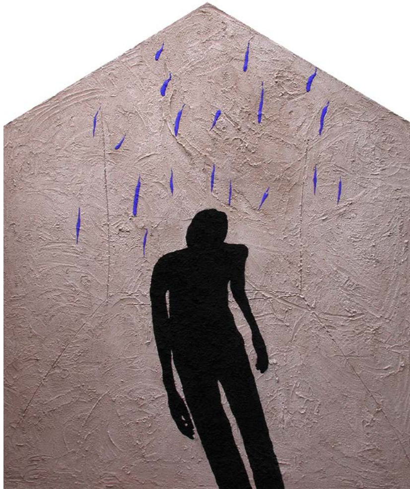
«Moonmanshadow», 2001, στάχτη, κάρβουνο, σκόνες, κόλλα, 200 X 170 cm