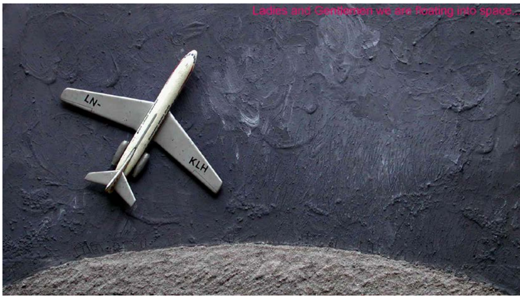
«Ladies and Gentlemen we are floating into space...», 1987 – 1995, μεταλλική στάχτη, μολύβι, ακρυλικά, παιδικό παιχνίδι, 71 X 40 cm