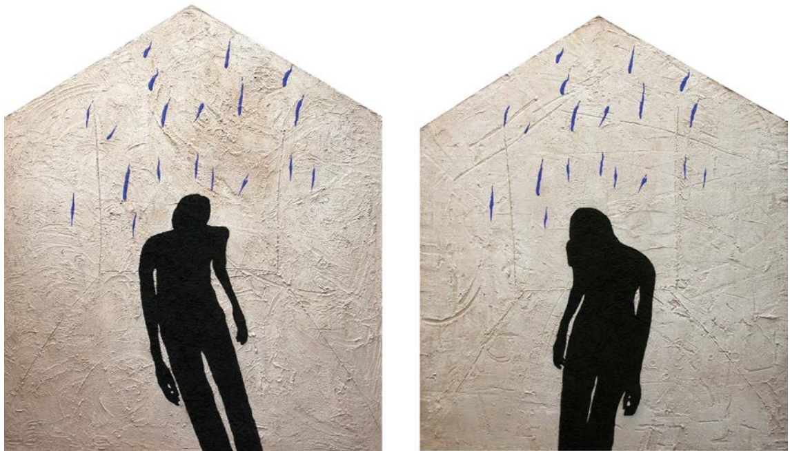
«Moon exit» δίπτυχο, 2001, στάχτη, κάρβουνο, σκόνες, κόλλα, 200 X 340 cm