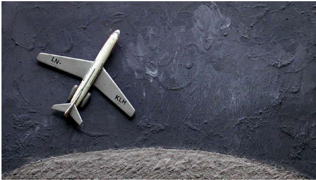
«Plane», 1987 – 1995, μεταλλική στάχτη, μολύβι, ακρυλικά, παιδικό παιχνίδι, 71 X 40 cm