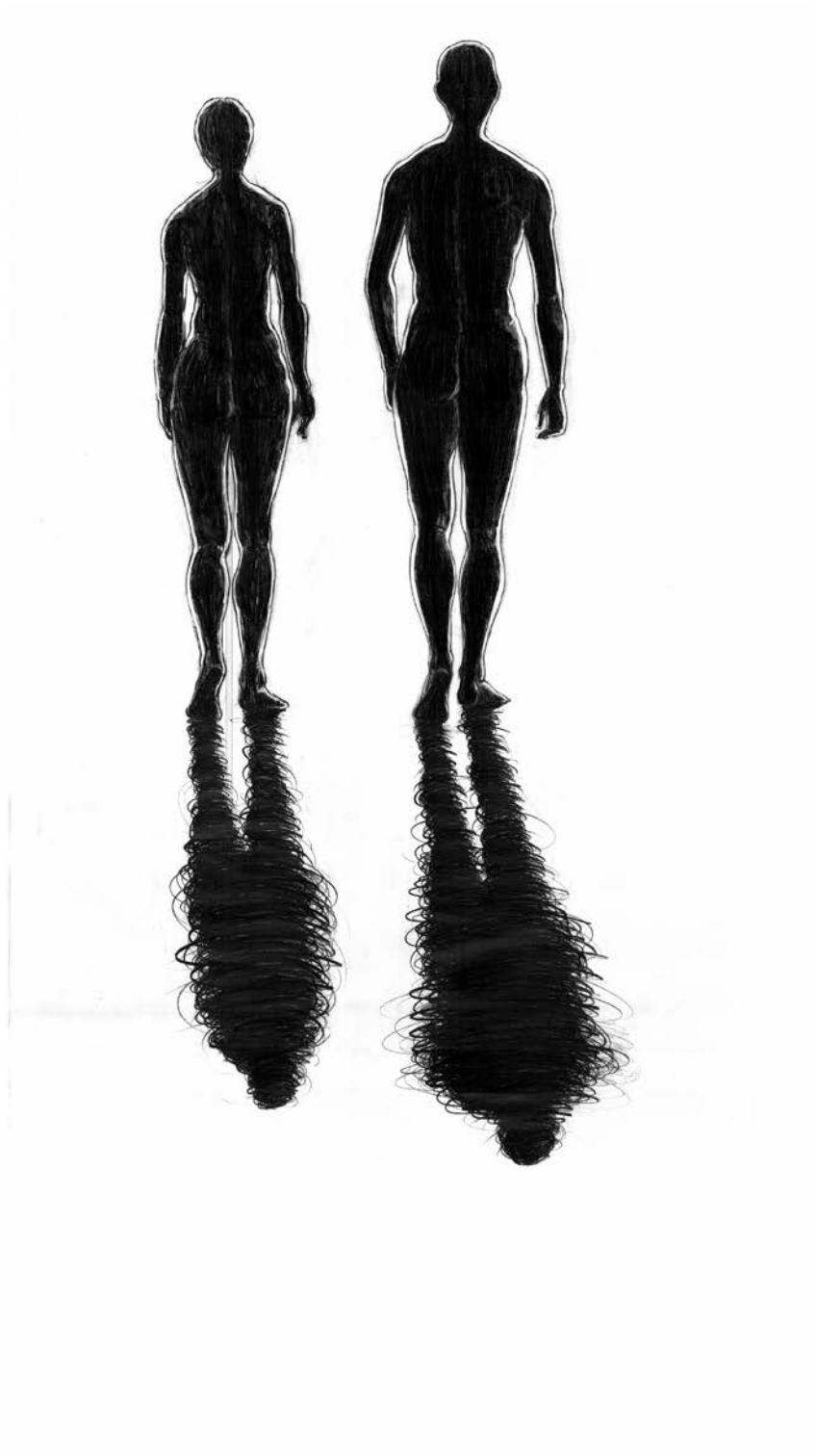
«Ζευγάρι που φεύγει», 1990 - 2001, μολύβι σε χαρτί, 100 X 50 cm