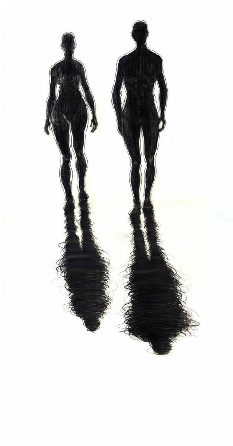
«Ζευγάρι που περπατάει», 1990 - 2001, μολύβι σε χαρτί, 100 X 50 cm