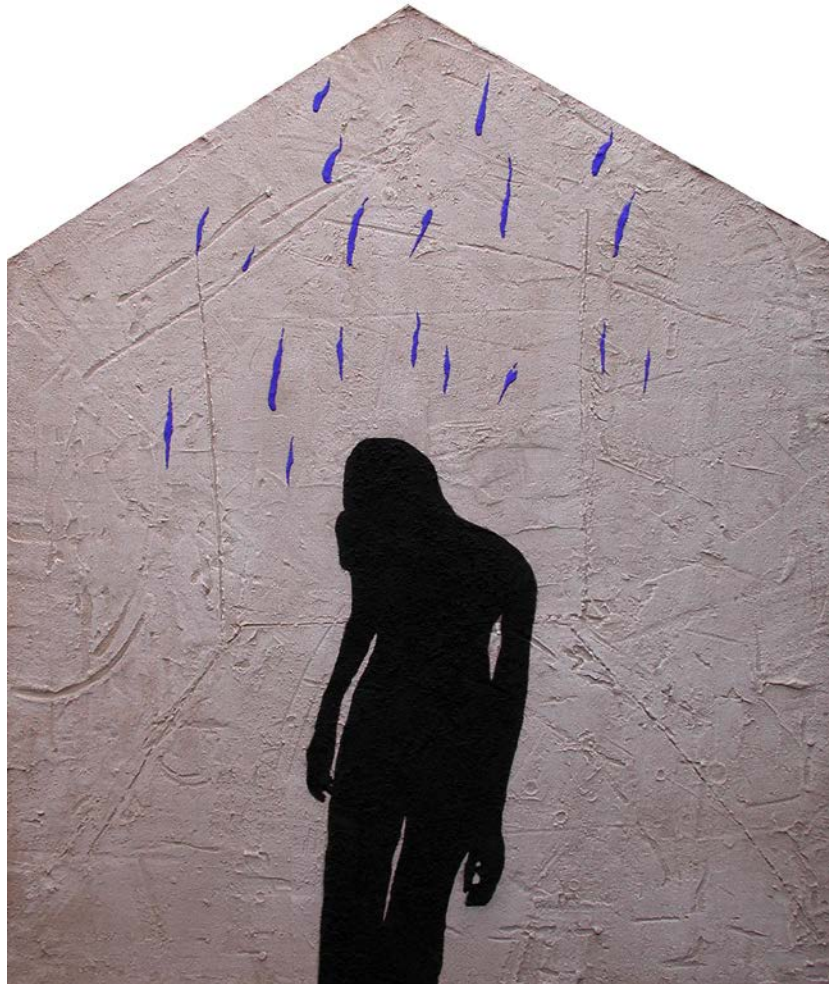
«Moonwomanshadow», 2001, στάχτη, κάρβουνο, σκόνες, κόλλα, 200 X 170 cm