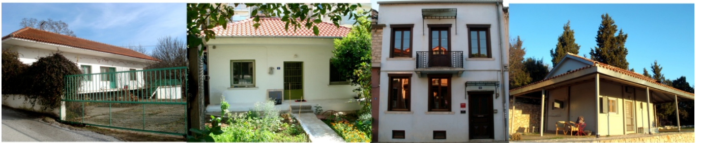
«Καταφύγια», 1983 – 2013, φερτές ύλες, διαστάσεις μεταβλητές